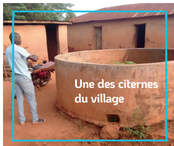
Une des citernes du village

À Sahou , les conditions de vie sont précaires. Le puits n'est pas fonctionnel et les citernes sont défectueuses.